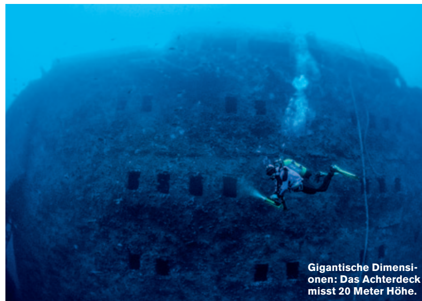
Gigantische Dimensionen: Das Achterdeck misst 20 Meter Höhe.

Der preisgekrönte Autor schreibt für führende Medien wie DIE ZEIT, Die Welt, Spiegel, Neue Zürcher Zeitung und den Stern. Der Berliner interessiert sich sehr für Wracks und deren Geschichte.