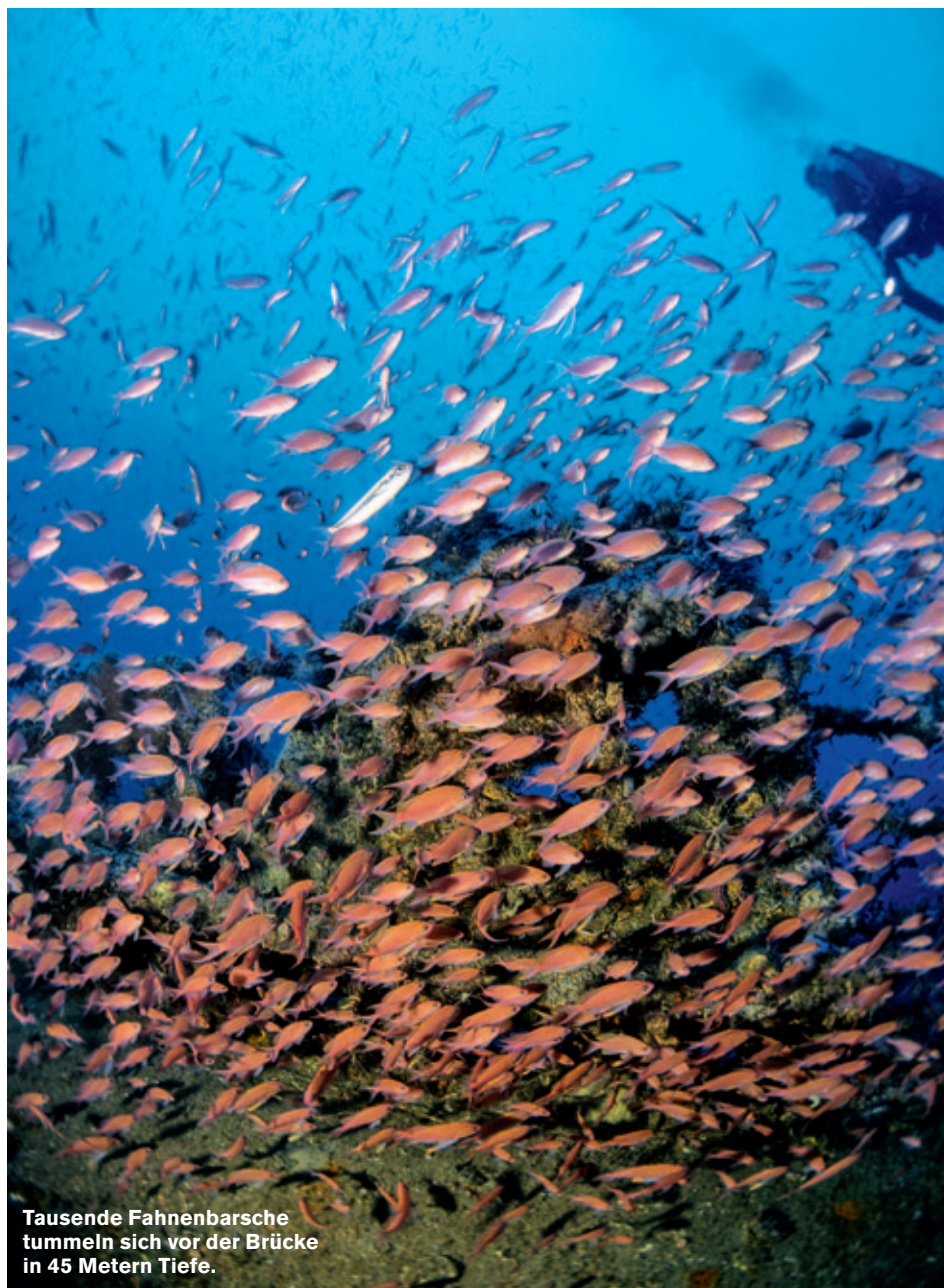
Tausende Fahnenbarsche tummeln sich vor der Brücke in 45 Metern Tiefe.

Auf dem Weg nach achtern zum Schornstein erwischt die Taucher eine heftige Strömung. Zentimeter für Zentimeter kämpfen sie sich nun voran. Pause machen geht nicht. Und trotzdem hat das seinen ganz eigenen Reiz, passt irgendwie zu diesem Spielplatz der Superlative. Die „Haven“ ist das größte und meistbetauchte Wrack des gesamten Mittelmeeres. Dank der