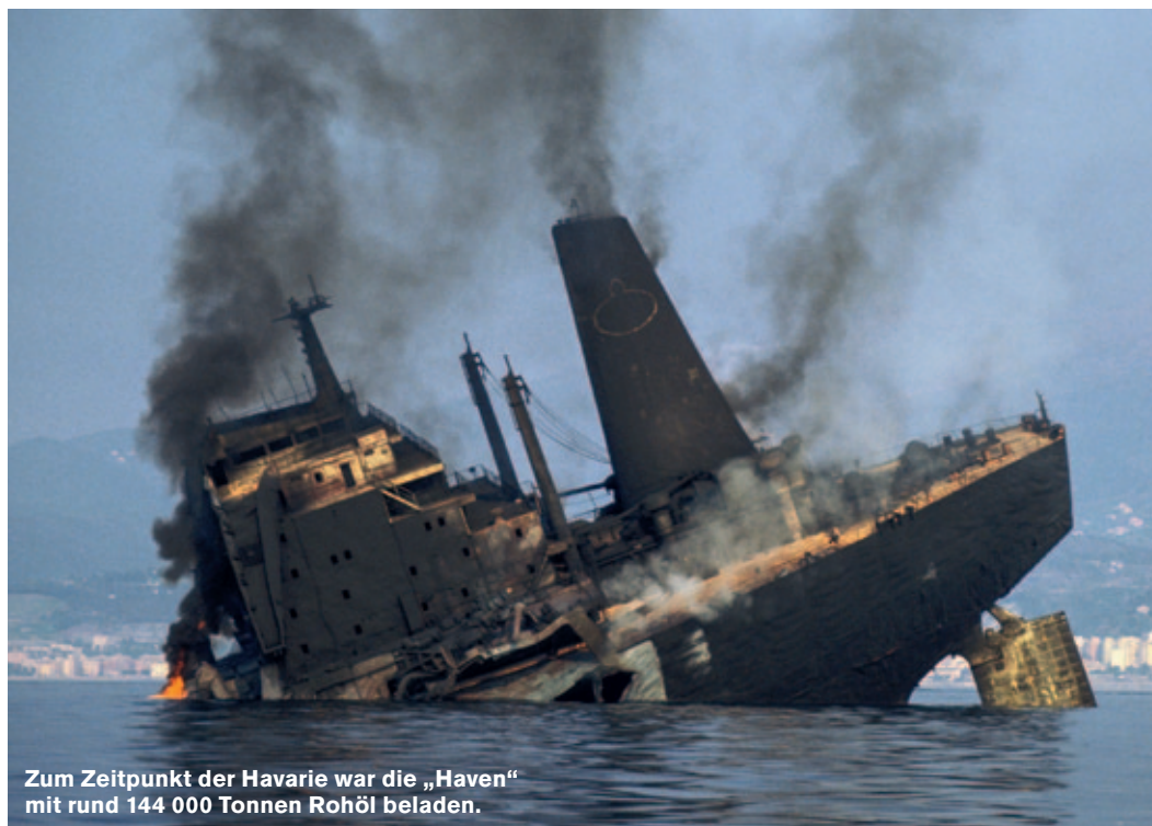
Zum Zeitpunkt der Havarie war die „Haven“ mit rund 144 000 Tonnen Rohöl beladen.

Als das Tauchboot die „Haven“ ansteuert, hängen schwere Wolken tief über dem Wasser. Minuten später ist die kleine Gruppe dann von einer fremden Welt umfungen. Eine Führungsleine, die sich irgendwo im Dunklen verliert, leitet sie direkt zu dem gigantischen Stahlkoloss – dem 250 Meter langen Heckteil des Wracks.