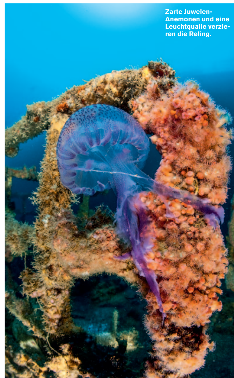
Zarte Juwelen-Anemonen und eine Leuchtqualle verzieren die Reling.

Tag 2, Freitag, 12. April: Zwar legen Bergungsteams endlich kilometerlange Barrieren aus, doch immer wieder schwappt das Rohöl darüber hinweg. Wochen später wird die Küste von Ligurien über Monaco bis hin zur Côte d'Azur verseucht sein und en-