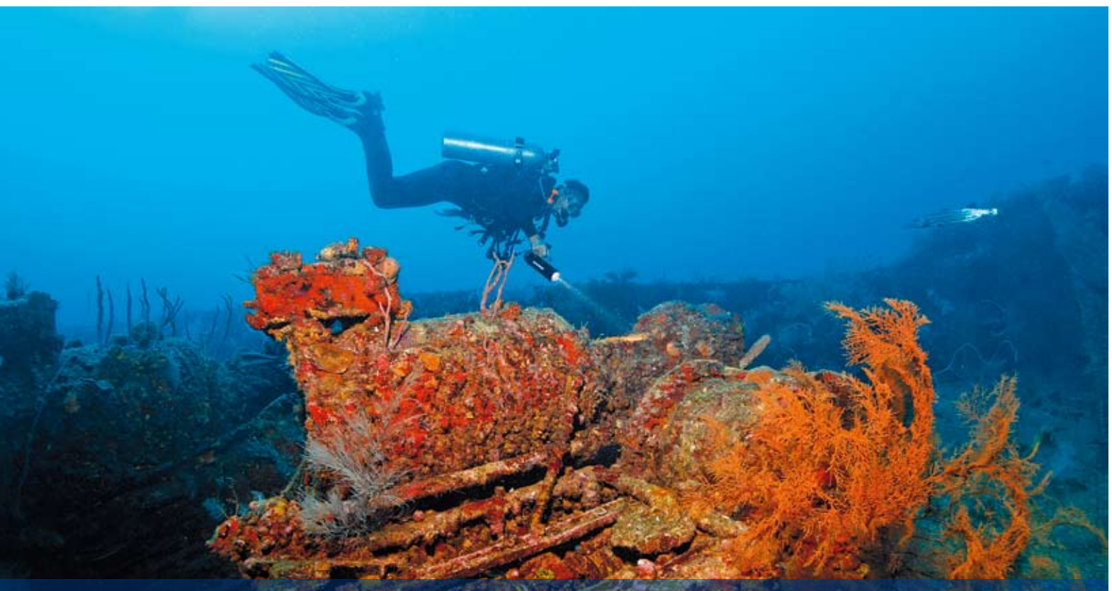
Korallen, aber wenig Fisch: Die Bianca C ist zwar dicht bewachsen, man trifft aber verhältnismäßig wenig Fische. Mit etwas Glück wird man während des Tauchgangs von Barrakudas begleitet.

Wir lassen uns mit der sanften Unterwasserströmung über die Backbordseite Richtung Bug treiben. Vorbei an etlichen Bullaugen ohne Fenster, die uns geheimnisvolle Einblicke ins Schiffinnere gewähren. Sämtliche Scheiben sind dem Flammeninferno zum Opfer gefallen. Der Blick in die düsteren Katakomben lässt mehr errahnen als erkennen. Erschwe-